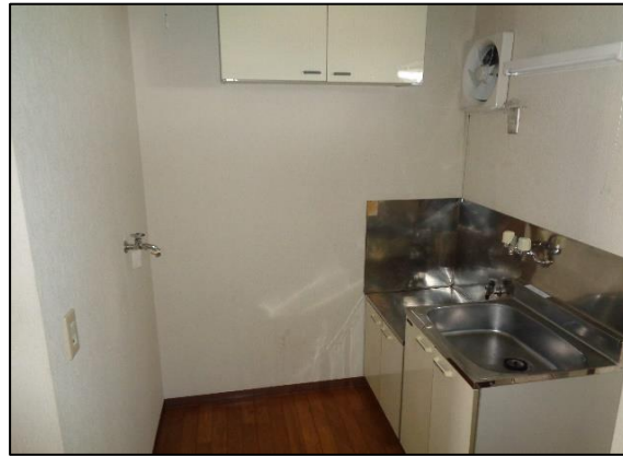
洗濯機・冷蔵庫スペース