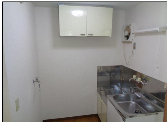
冷蔵庫・洗濯機置き場