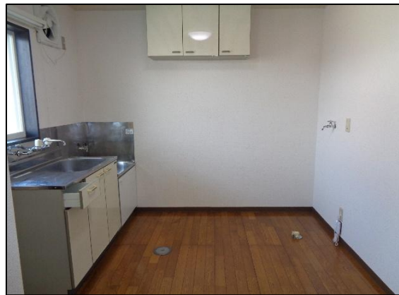
洗濯機・冷蔵庫スペース